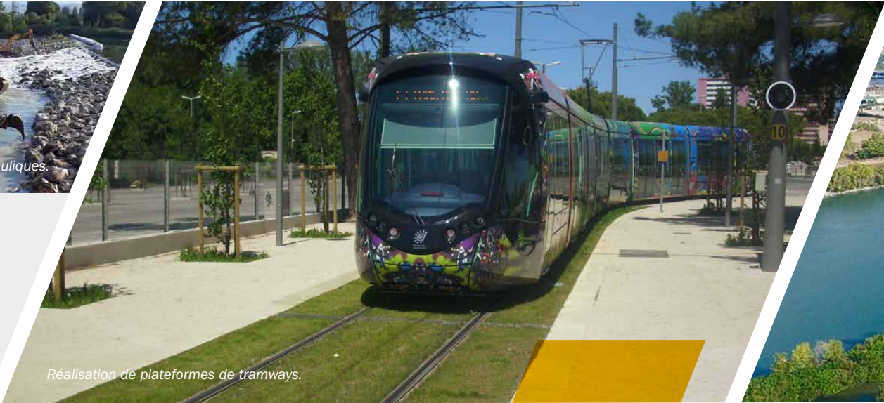
Réalisation de plateformes de tramways.