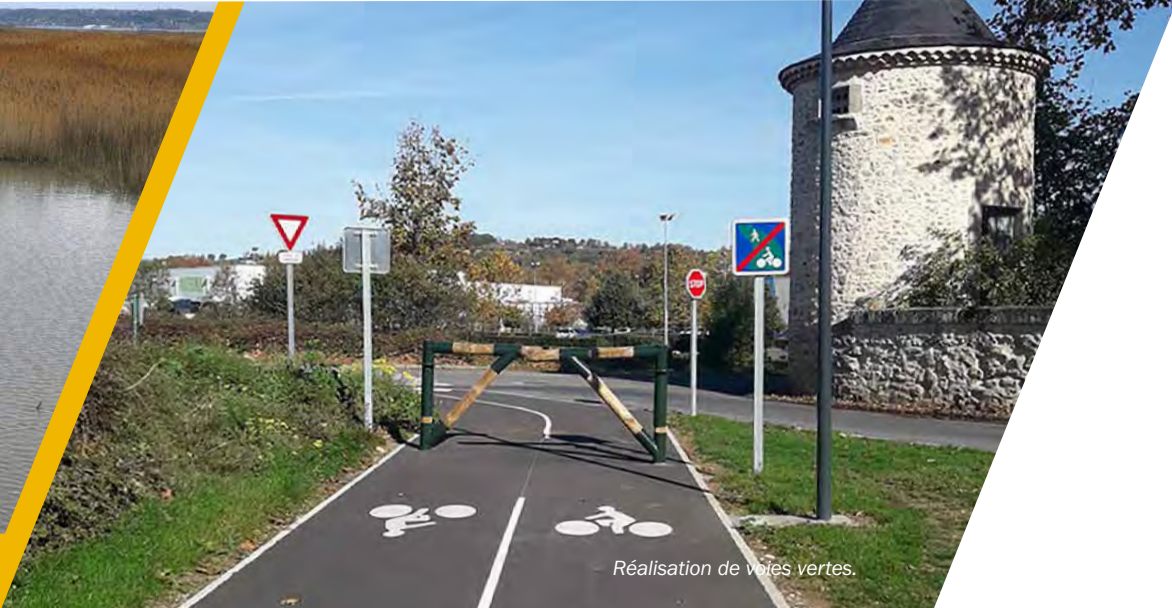
Réalisation de voies vertes.