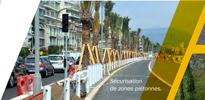
Sécurisation de zones piétonnes.