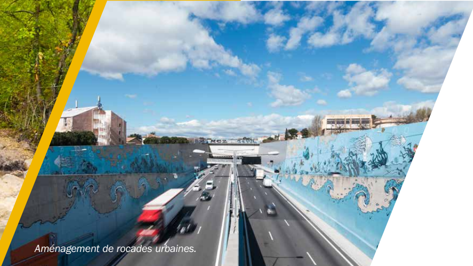
Aménagement de roclades urbaines.