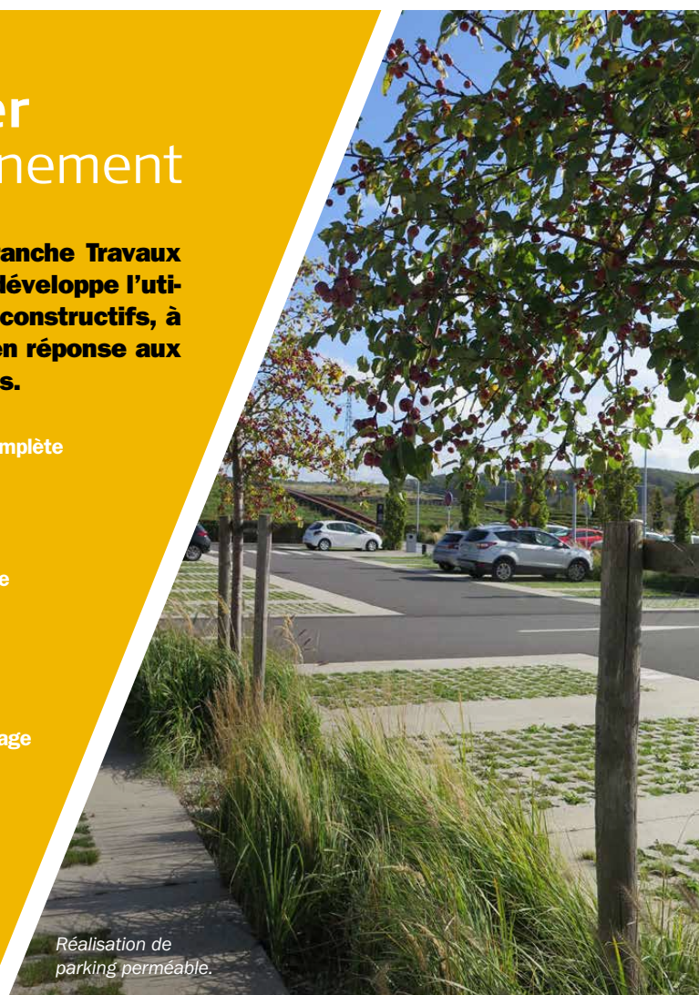
Réalisation de parking perméable.

www.oceanpolaire.org/expedition-polar-pod/