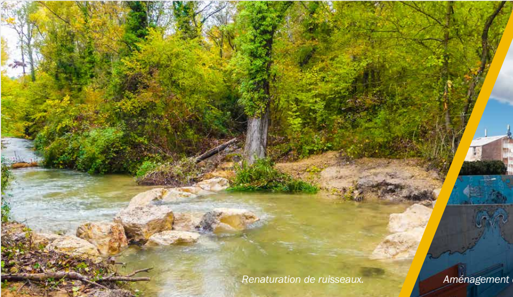
Renaturation de ruisseaux.