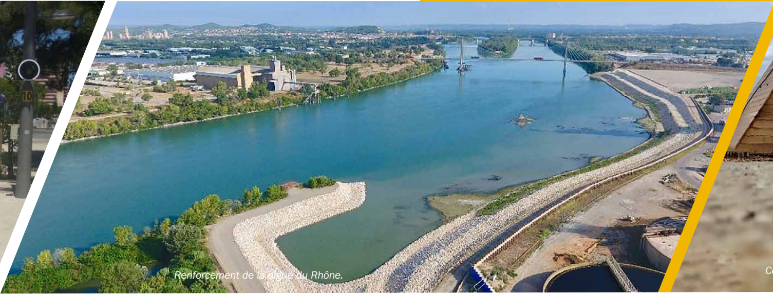
Renforcement de la digue du Rhône.