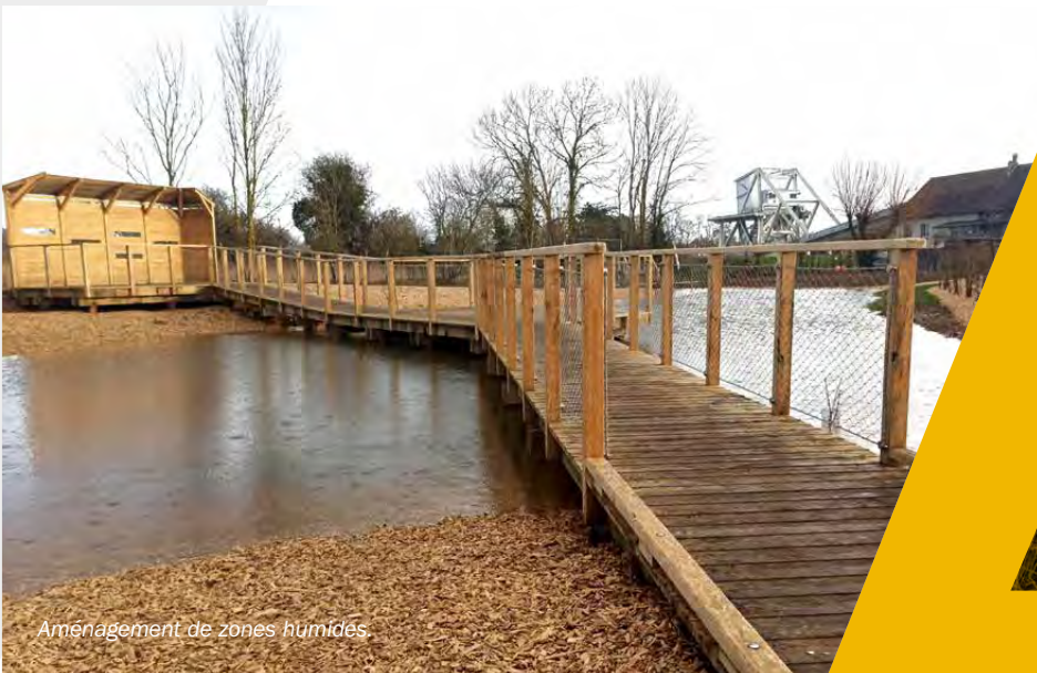
Aménagement de zones humides.