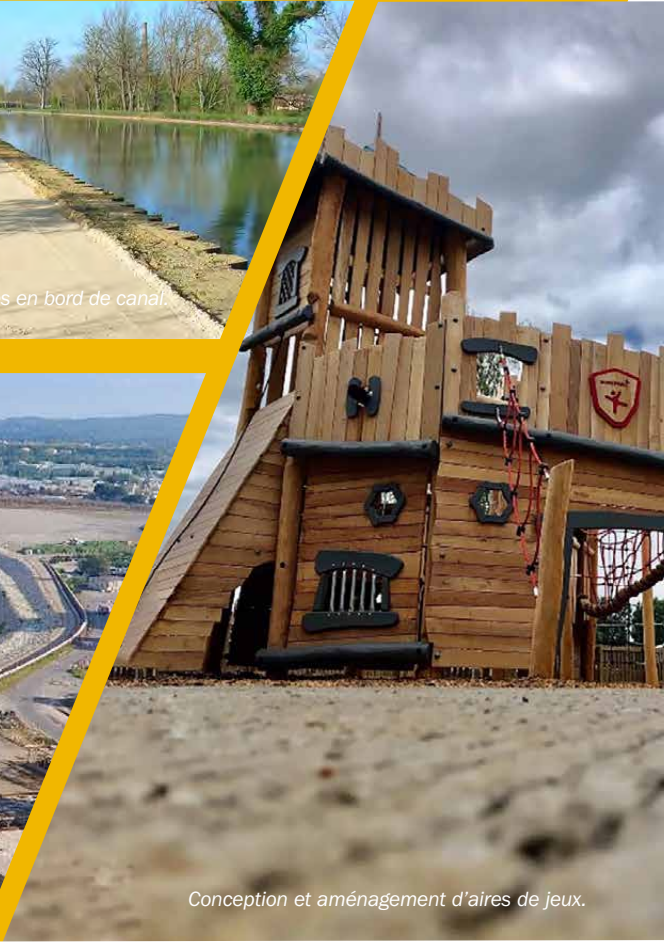
Conception et aménagement d'aires de jeux.