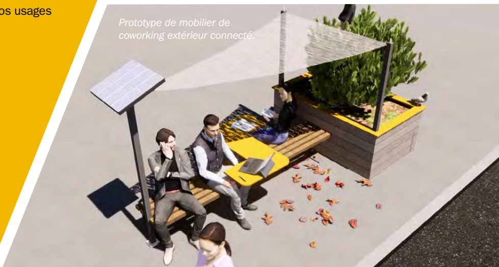
Prototype de mobilier de coworking extérieur connecté.