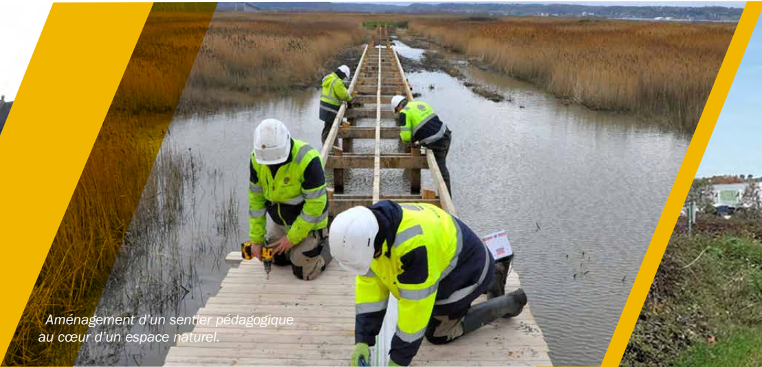
Aménagement d'un sentier pédagogique au cœur d'un espace naturel.