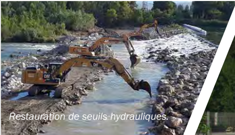
Restauration de seuils hydrauliques.