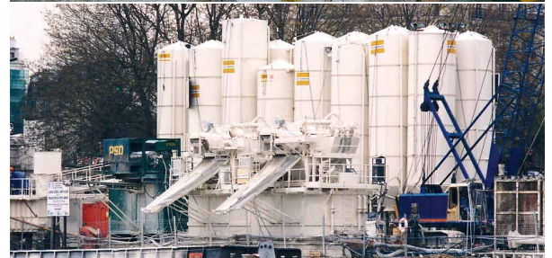
APRÈS RECYCLAGE, LES DÉBLAIS DU CHANTIER TIMA À PARIS ÉTAIENT DIRECTEMENT VERSÉS DANS UNE BARGE POUR ÉVACUATION PAR VOIE FLUVIALE.