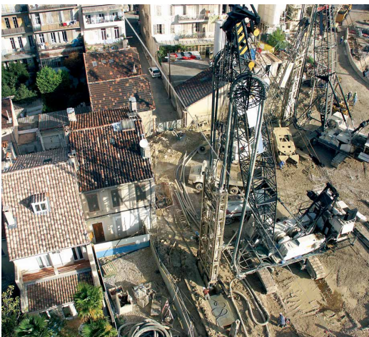
CONTRAINTES DU CHANTIER DE LA STATION BLANCARDE DU MÉTRO DE MARSEILLE : TERRAIN DUR, DÉLAIS COURTS ET PROXIMITÉ DES HABITATIONS

Nota : L'emploi de la Rotoforeuse® est couplé à celui d'une benne à câble pour forer les premiers mètres de paroi moulée.