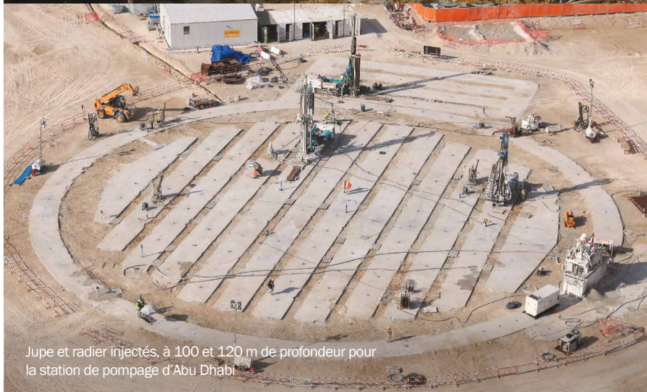
Jupe et radier injectés, à 100 et 120 m de profondeur pour la station de pompage d'Abu Dhabi