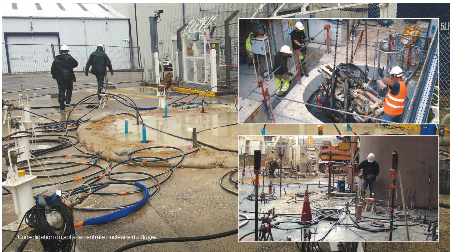
Consolidation du sol à la centrale nucléaire du Bugey.