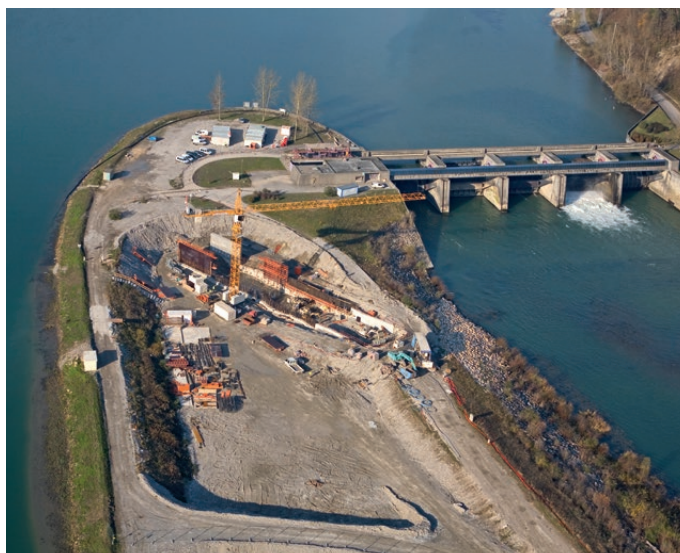
BARRAGE, CENTRALE HYDROÉLECTRIQUE