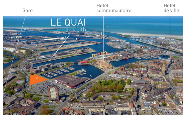
L'implantation stratégique du pôle en fait un projet emblématique du renouveau dunkerquois

Ce chantier d'envergure regroupant différents usages a officiellement été lancé courant mai 2021 pour s'achever au cours du second semestre 2022.