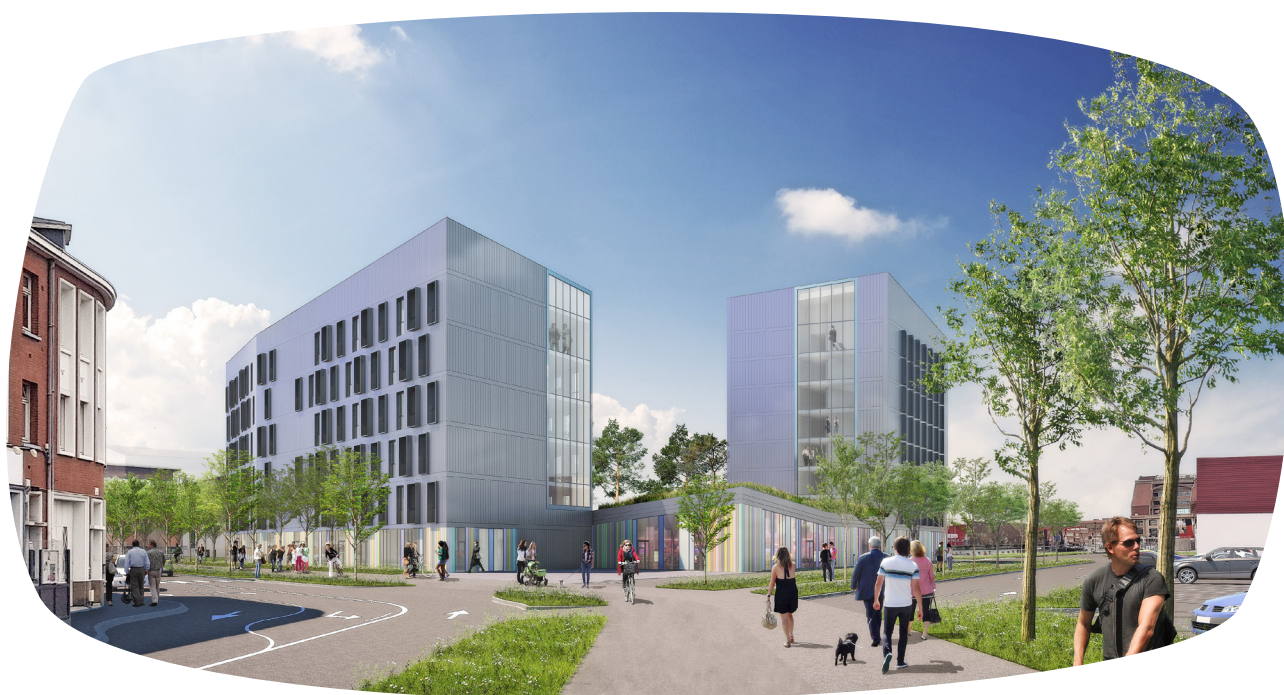
Le pôle d'activités du quai de Leith accueillera un hôtel, des commerces et bureaux © BLAQ architectures

Afin d'accompagner la CUD dans ce projet emblématique de renouvellement urbain de la Ville et de la Communauté Urbaine, Spie batignolles immobilier et S3D, partenaire local, se sont associés avec l'enjeu de satisfaire aux attentes du territoire et de sa stratégie de développement économique.