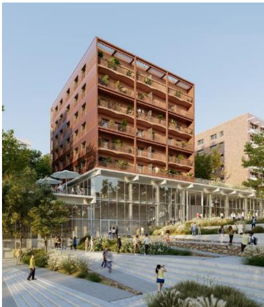
(Architectes : UAPS, Atelier Pascal Gontier, Atelier Architecture Brenac Gonzalez associés, NP2F, Fagart & Fontana)

Réhabilitation de la résidence Schuman à Poitiers (86) pour Ekidom par Spie batignolles construction régions – 97 logements sociaux – Projet en cours