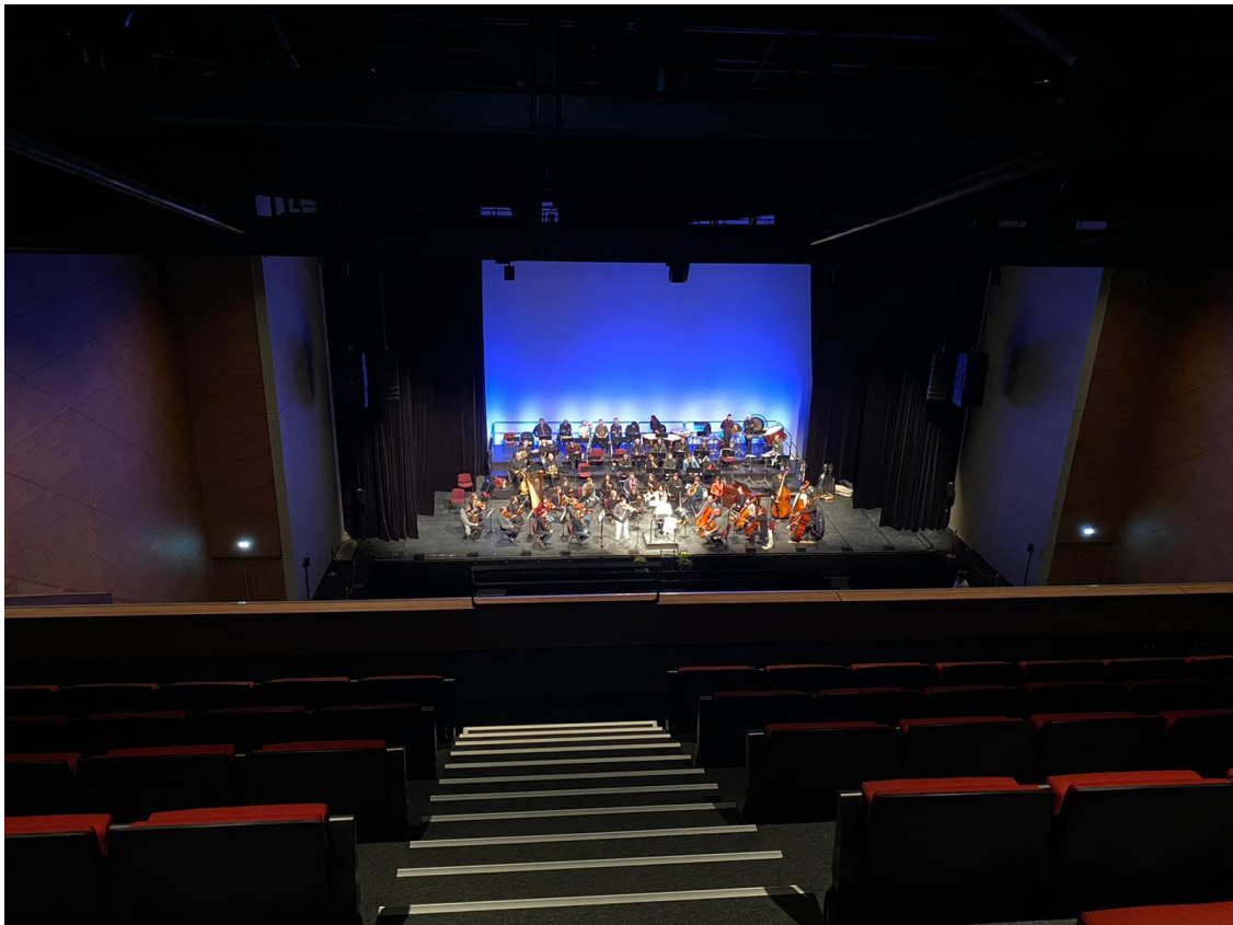
Orchestre de Douai Hauts-de-France

Cette réalisation illustre la capacité de Spie batignolles à contribuer au dynamisme des territoires par une approche collaborative des projets et la construction de lieux de vie agréables, flexibles, en parfaite cohérence avec leur environnement historique, économique et sociale.